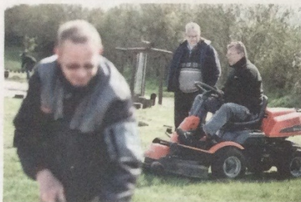
Jordløse var blandt de allerførste landsbyer i Danmark, som etablerede et korps af landsbypedeller.

sp@fyens.dk Lise Wolf, 65 45 52 47, lwo@fyens.dk Henning Frandsen, 65 45 52 48, hef@fyens.dk Martin Kloster, 65 45 52 91, makl@fyens.dk